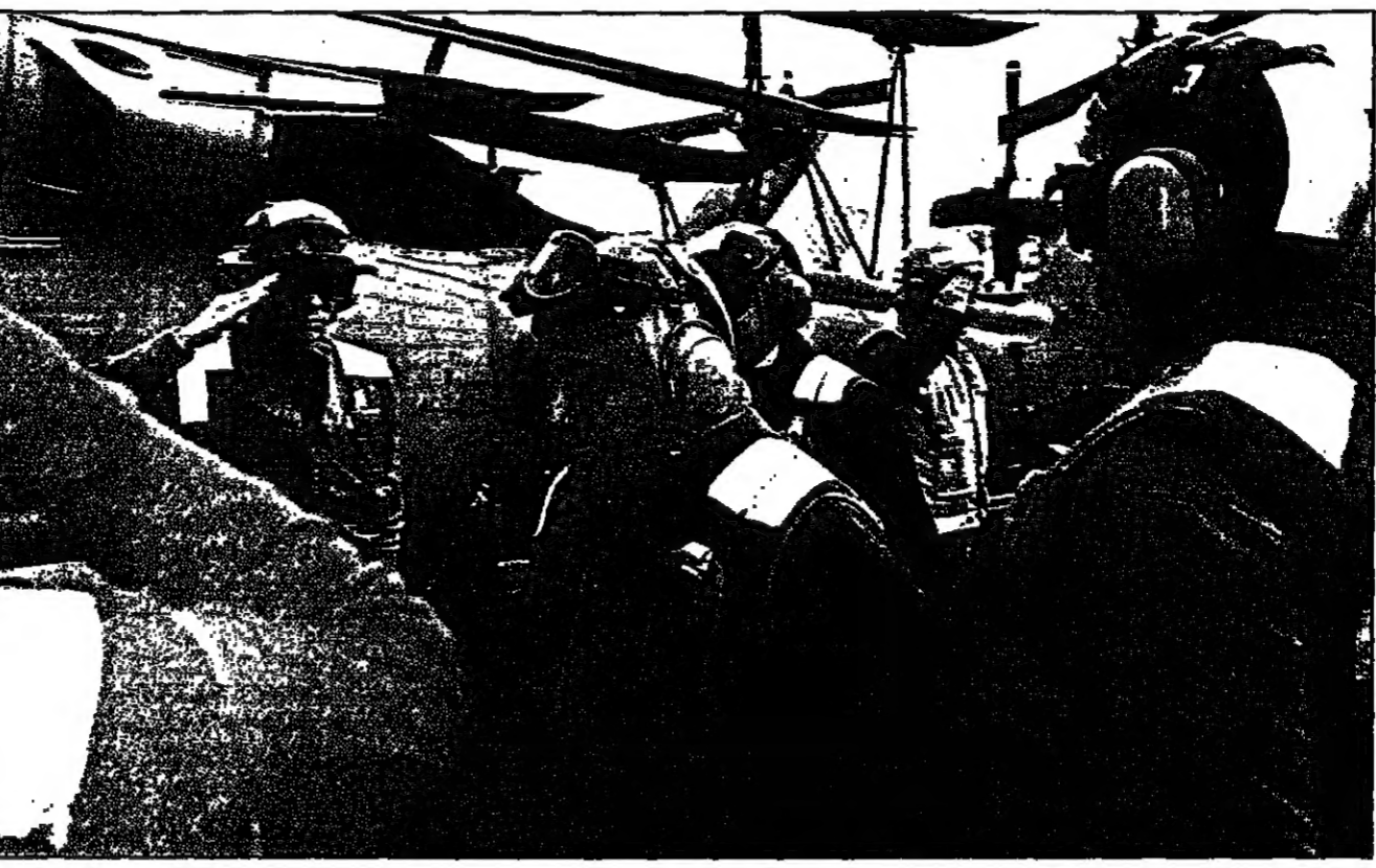
ويزر الدفاع الاسرائيلي اسحق موردياخي (وسط) على متن حامله الطائرات الأمريكية تيمور رولت حيث اطعمه العسكريون الأمريكيون على خطهم في المنطقة

في غضون ذلك قالت مصادر عراقية في المنطقة ان الثلاثة من الزوار هم الرئيس العراقي صدام حسين، ابن عمه ورئيس الوزراء نوري السعيد، ووزير الدفاع اسحق موردياخي. وقد تم استقبالهم في مطار بغداد في صباح يوم الاثنين الموافق 2 فبراير 1997. وتأتي الزيارة في إطار العلاقات الجيدة بين العراق والولايات المتحدة الأمريكية.